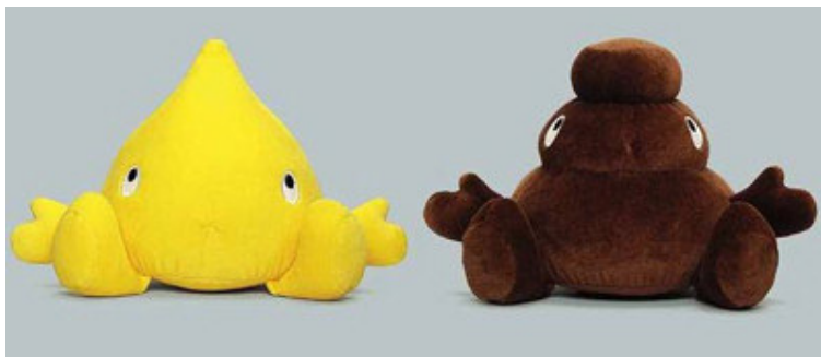
Рис. 16. Фотографический снимок детских игрушек, имитирующих человеческие фекалии 31

Предлагаются «игрушки», имитирующие человеческие фекалии (см. рис. 16).