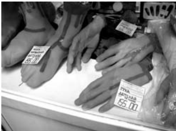
Рис. 18. Фотографический снимок игрушек, имитирующих человеческие травмы, ампутированные конечности и иные части человеческого тела 33