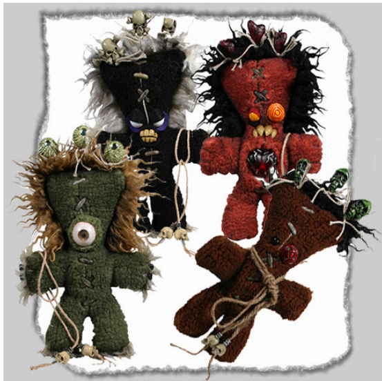
Рис. 17. Фотографический снимок игрушек, оказывающих мистифицирующее воздействие на сознание детей 32

Предлагаются игрушки, имитирующие человеческие травмы, ампутированные конечности и иные части человеческого тела, например: «рука детская кровавая» , «нога детская» , «рука с когтями» , «череп с глазом» и др. (см. рис. 18).