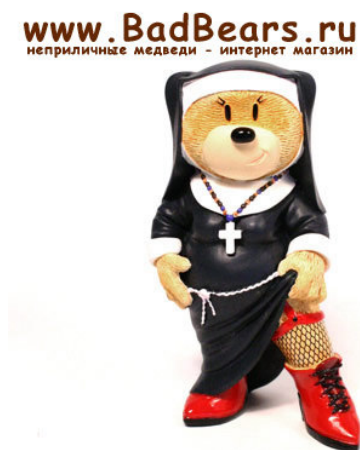
Рис. 5. Фотографический снимок игрушки «Медведица Тереза» 11

Или Медведь Харли Дэвид из серии «Неприличные медведи», сидящий на явно узнаваемом христианском кресте (см. рис. 6).