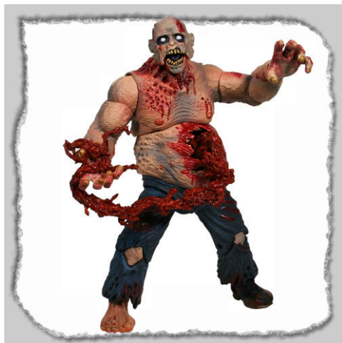
Рис. 24. Фотографический снимок игрушки «Кукла Зомби Earl Pale Strain Phase I» 43

Из той же серии «Кукла Зомби Earl Pale Strain Phase I» (см. рис. 24) и «Кукла Зомби Earl Pale Strain Phase II» (см. рис. 25).