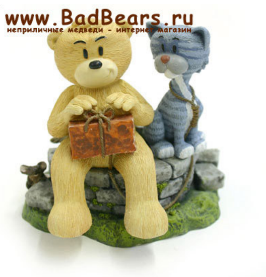
Рис. 12. Фотографический снимок игрушки «Red Hot Pussy – Tyson & Lucky» 24

Играющему ребенку предоставлена возможность издеваться над детской игрушкой, пытаться ее убить. Именно в этом и состоит смысл некоторых так называемых детских игрушек.