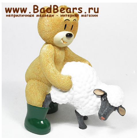
Рис. 9. Фотографический снимок игрушки «Медведь Эван» 19

столовой уволили, и из пельменной. Френк не знает, почему так происходит, ведь где еще найти такого медведя, просто влюбленного в свое дело. Он любит все виды пищи, и трепетно относится к любым ингредиентам. Еда отвечает ему взаимностью, и даже согревает, когда холодно, в любых местах!» 18 .