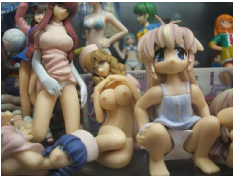
Рис. 2. Фотографический снимок «кукол-анимашек» 5

В продаже представлены «игрушки», активно эксплуатирующие интерес детей к сексу. Например, «куклы-анимашки», у которых детально выполнены гениталии, их можно внимательно рассмотреть, сняв одежду или сдвинув ее части в сторону; на некоторых таких куклах ничего не надето (см. рис. 2).