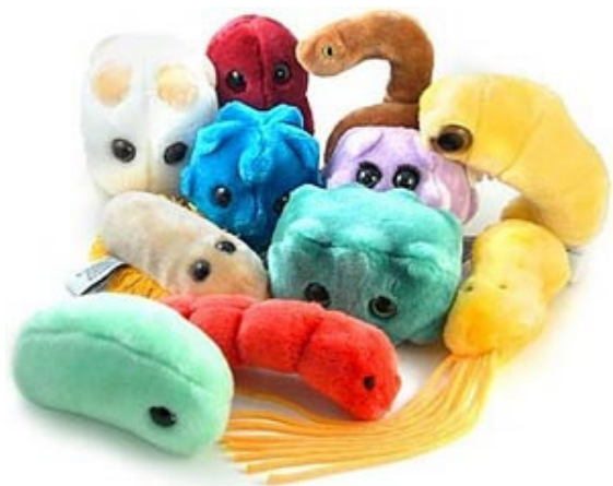
Рис. 15. Фотографический снимок детских игрушек в форму микробов и вирусов 30

На рынке детских игрушек появились детские игрушки в форме микробов и вирусов, в том числе ВИЧ-инфекции, сифилиса, гонореи, дизентерии, коровьего бешенства (см. рис. 15).