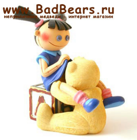
Рис. 4. Фотографический снимок игрушки «Пара медведей Кенни и Хони» 9

Предлагаются игрушки, соединяющие вместе эротику и глумление над религиозными чувствами верующих.