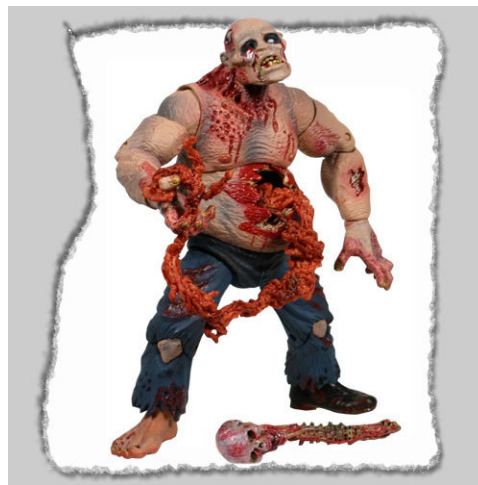
Рис. 25. Фотографический снимок игрушки «Кукла Зомби Earl Pale Strain Phase II» 44

Смешными, забавными и допустимыми для детей такие игрушки могут быть только в сознании психически или нравственно нездоровых лиц. А ситуация на российском рынке детских игрушек может быть оценена как нравственно катастрофическая, в части ее нравственных аспектов.