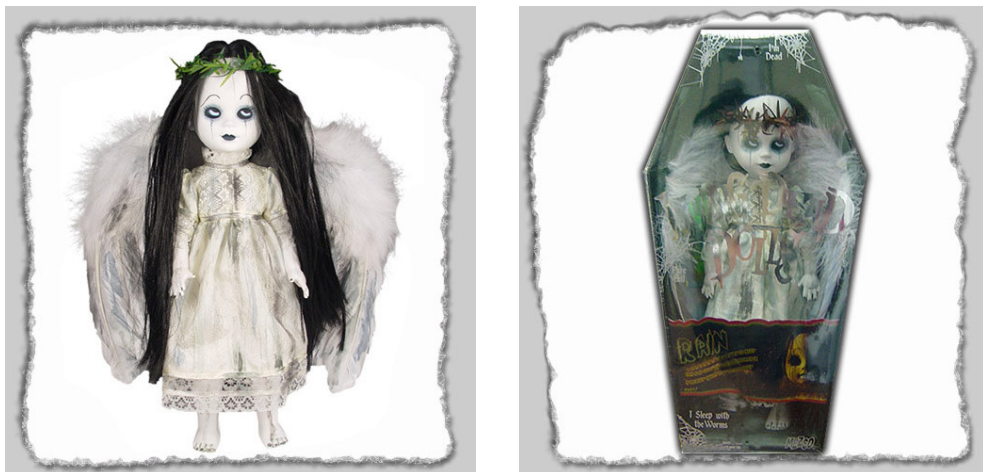
Рис. 21. Фотографический снимок игрушки «Кукла Рэйн» 39

Предлагаются «игрушки» устрашающего характера, детально показывающие расчлененные человеческие тела и предусматривающие действия играющего в них лица, направленные на совершение манипуляций, связанных с расчленением человеческих тел или с ампутированными их частями тела.