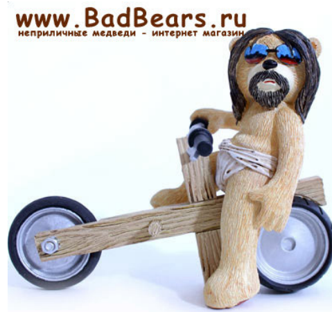
Рис. 6. Фотографический снимок игрушки «Медведь Харли Дэвид» 12