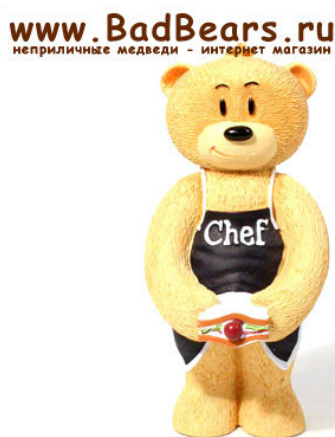
Рис. 10. Фотографический снимок игрушки «Медведь Френк» 20

Существуют детские игрушки, формирующие садистские наклонности детей, например, детская игрушка «Бешеная курица» (см. рис.11), в описании которой производителем заявлено следующее: «Курица машет крыльшками и двигает ножками. Она отлично танцует под музыку! Но, если Вы возьмете ее за шейку, она начнет издавать предсмертные стоны и попытается вырваться из Ваших рук. Такое представление пропустить нельзя. А стоит Вам отпустить “Бешеную курицу”, как она продолжит