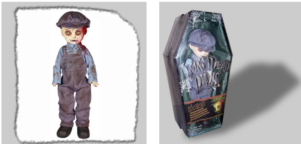
Рис. 20. Фотографический снимок игрушки «Кукла Айза» 37

В продаже имеется «Кукла Рэйн» (см. рис. 21), о которой в аннотации говорится: «Дата смерти: 10 августа 2005 года.