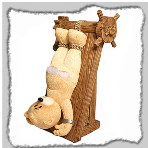
Рис. 14. Фотографический снимок игрушки «Медведь Стретч» 29

На рынке детских игрушек появились детские игрушки в форме микробов и вирусов, в том числе ВИЧ-инфекции, сифилиса, гонореи, дизентерии, коровьего бешенства (см. рис. 15).