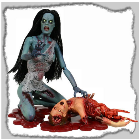
Рис. 22. Фотографический снимок игрушки «Кукла Зомби Hellen Color Strain Phase I» 41

Например, предлагаются «Кукла Зомби Hellen Color Strain Phase I» (см. рис. 22) и «Кукла Зомби Hellen Color Strain Phase II» (см. рис. 23), в аннотации к которым сказано: «Всемирная эпидемия вышла из-под контроля. Утечка вируса “After Life” привела к заражению большинства человечества. Нападение Живых мертвецов кажется неотвратимым. Все надежды потеряны для мира, который мы знали. Мы можем только просить высшие силы, чтобы выжили хоть немногие для продолжения рода человеческого. 1257.00 руб. Фигурка Зомби высотой около 18 см.» 40