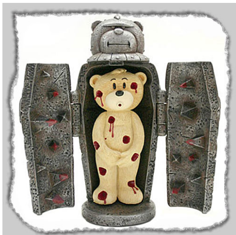
Рис. 13. Фотографический снимок игрушки «Медведь мистер Хайд» 28