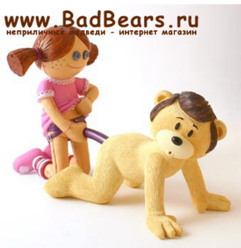
Рис. 7. Фотографический снимок игрушки «Пара медведей Сеймур и Ванда» 15