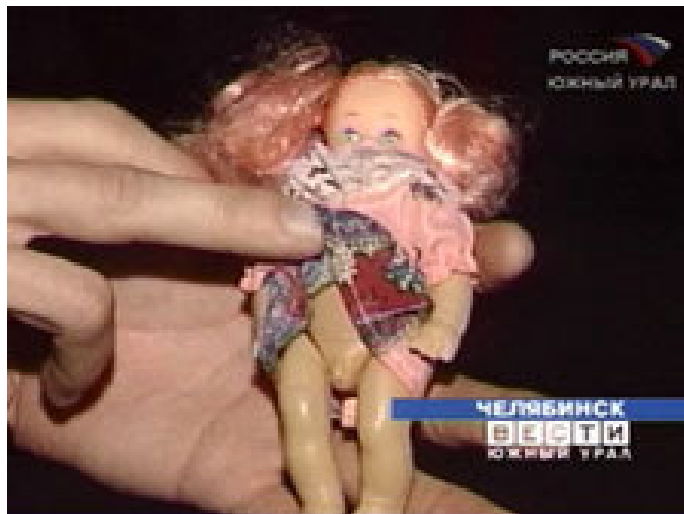
Рис. 1. Фотографический снимок «игрушки»-гермафродита 4

детской психики, внедрявших в сознание детей сексуальные отклонения и иные психофизические нарушения.