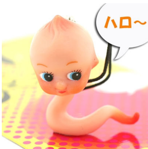
Рис. 3. Фотографический снимок игрушки «Купидончик-сперматозоид» 8

Предлагается «коллекционная игрушка» 6 «Пара медведей Кенни и Хони» (см. рис. 4): «Нельзя оставлять без присмотра подростков, в период полового созревания! Играли Кенни и Хони в куклы, складывали кубики, и...попалась им на глаза странная книжка «Камасутра». Не поняв ничего, было решено изобразить картинки. А, кажется, в отличие от Кенни, Хони догадывается, о чем идет речь!» 7