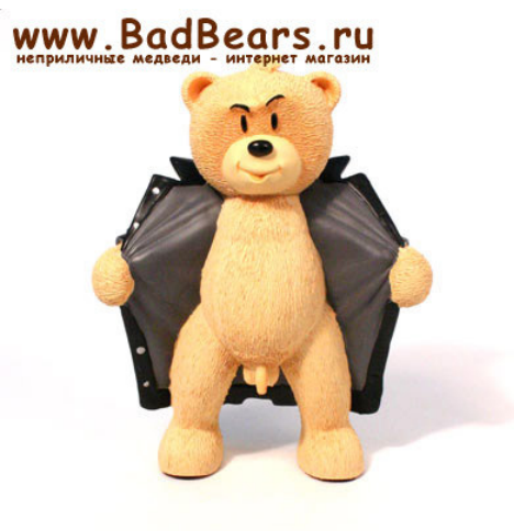
Рис. 8. Фотографический снимок игрушки «медведь-эксгибиционист Вилли» 16

Или игрушку Медведя Эвана, осуществляющего половой акт с овцой (см. рис. 9), в аннотации к которому написано следующее: «Фу! Что Вы такое подумали! Сразу видно: вы мало, что понимаете в медведях! Наверное, после знакомства с Неприличными Медведями, Вы стали воспринимать их, как вполне равных по интеллекту, в общем, мало, чем от нас отличающихся. Вы совершенно правы: у них такие же чувства, мысли, проблемы и радости. Да они порой куда прикольней и сексуальней нас, Вы же сами видели! Но иногда животные инстинкты, знаете ли, дают о себе знать... Поэтому, в том, что вы видите, ничего предосудительного нет! Ну, любят они друг друга, в конце концов!» 17 .