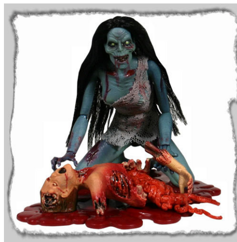
Рис. 23. Фотографический снимок игрушки «Кукла Зомби Hellen Color Strain Phase II» 42